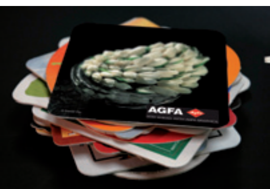
Gadgets personnalisés (sous-verres)

Grâce à sa grande polyvalence (par exemple: affiche grand format, matériel de P.L.V., boîtier de CD, sous-verre, gadgets...) et à un prix de vente abordable n'exigeant qu'un investissement limité :Anapurna M4F est l'imprimante U.V. idéale pour les entreprises œuvrant dans l'industrie de la sérigraphie ou de l'impression d'enseignes.