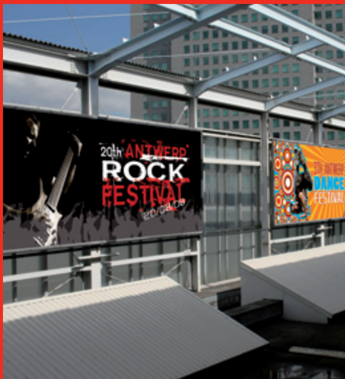
Banderoles grand format pour utilisation à l'extérieur