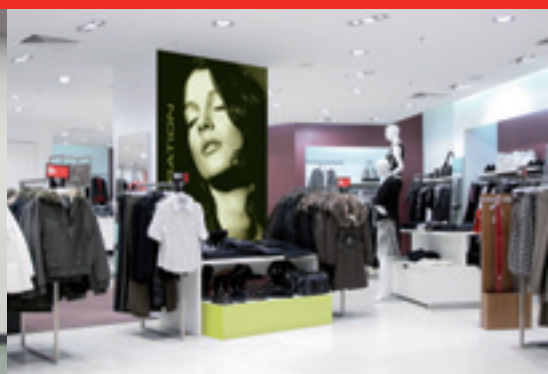
Gadgets de communication utilisés sur le lieu d'achat